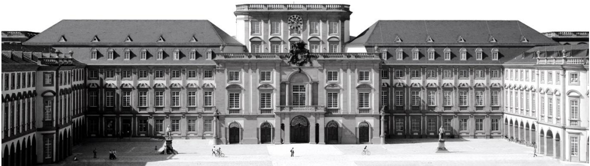
Schloss Mannheim, Sitz der Universität Mannheim

Bitte senden Sie den vollständig ausgefüllten Fragebogen in dem beiliegenden Umschlag an uns zurück. Das Porto zahlen wir für Sie.