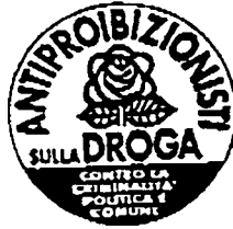
ANTIPROIBIZIONISTI SULLA DROGA