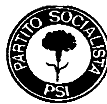
PSI (Partito Socialista Italiano)