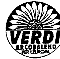
VERDI ARCOBALENO PER L'EUROPA