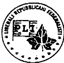
PLI/PRI/FED (Liberali, Repubblicani, Federalisti)