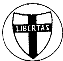
DC (Democrazia Cristiana)