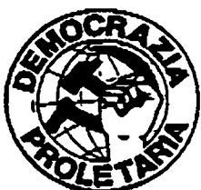
DP (Democrazia Proletaria)