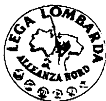
LEGA LOMBARDA ALLEANZA NORD