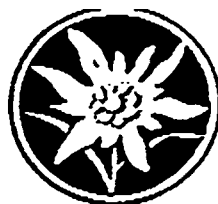
PPST (Partito Popolare Sud-Tirolese)