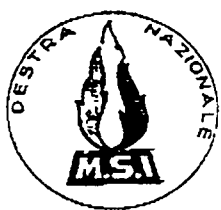
MSI (Movimento Sociale Italiano)