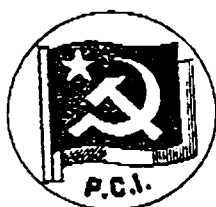
PCI (Partito Comunista Italiano)