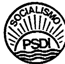
PSDI (Partito Socialista Democratico Italiano)